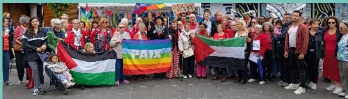
21 septembre 2025 : Journée internationale de la Paix, place du 11 novembre

Réservation recommandée : Mail : asiam92240@gmail.com à partir du 5 novembre Tél : 07 61 82 03 43