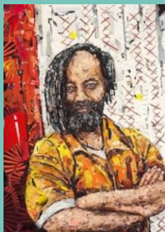
CŒuvre de Mustapha Boutadjine

Mumia Abu-Jamal est citoyen d'honneur de la Ville de Malakoff