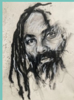
CŒuvre d'Ernest Pignon

Présentation d'une quarantaine de ces œuvres